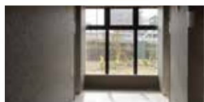
エレベータ 3 基