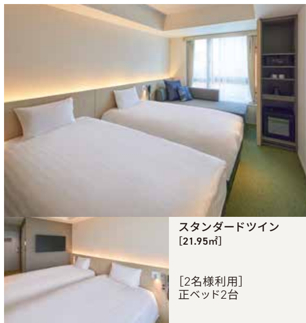
スタンダードツイン [21.95㎡] [2名様利用] 正ベッド2台