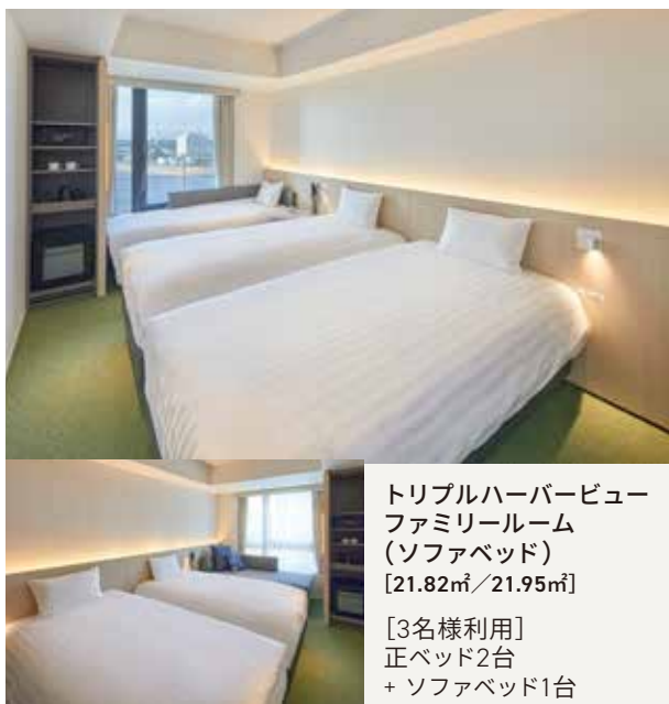
トリプルハーバービュー ファミリールーム (ソファベッド) [21.82㎡/21.95㎡] [3名様利用] 正ベッド2台 + ソファベッド1台

西に面した部屋からは堺旧港を望み、東に面した部屋からは歴史深い堺の街並みを見渡します。 各客室は、細部にまでこだわった設えが施されており、客室タイプに応じた異なる眺望をお選びいただけます。