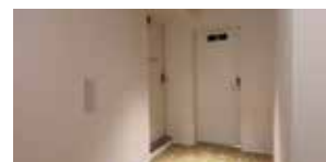
非常口1フロア2カ所